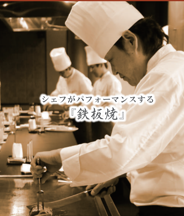
シェフがパフォーマンスする『鉄板焼』