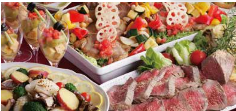
※写真はイメージです ※他の割引及びプランとの併用はできません ※すべて税・サービス料込