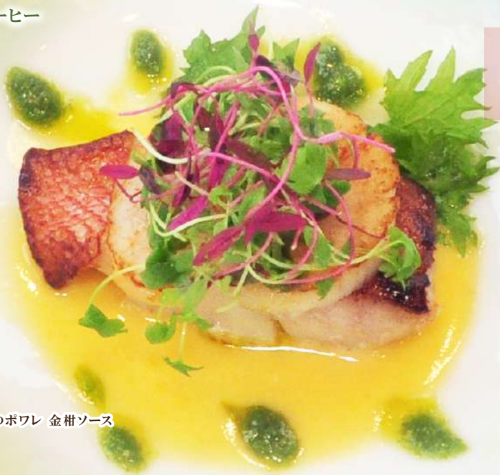
真鯛のポワレ 金柑ソース