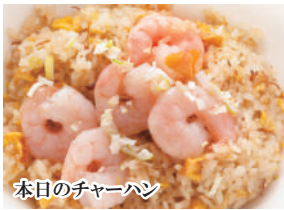
本日のチャーハン