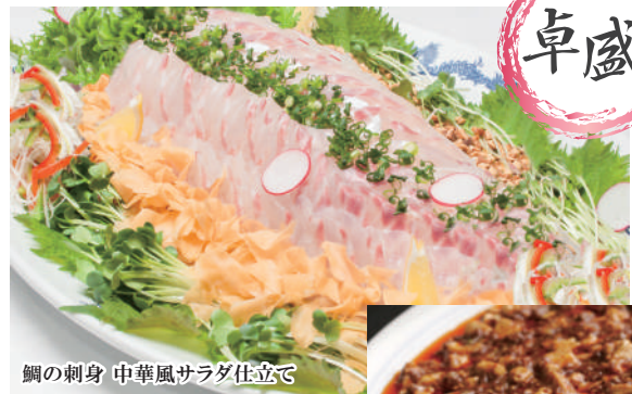
鯛の刺身 中華風サラダ仕立て