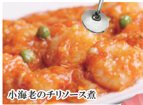
小海老のチリソース煮